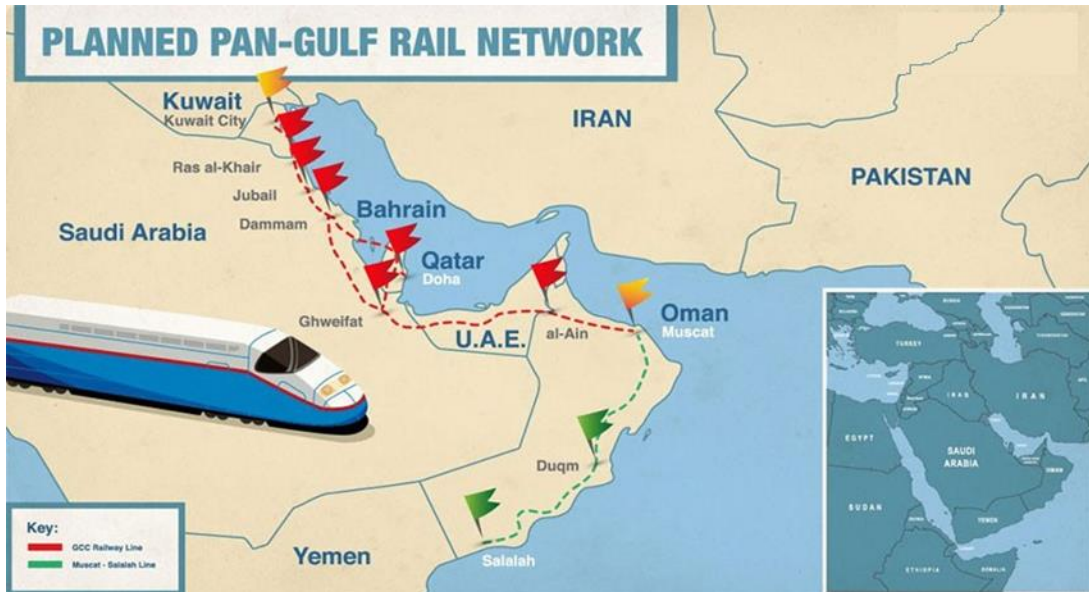
KƏŞ ölkələrini birləşdirən "Körfəz qatarı" dəmir yolu xətti

Lakin 2008-2009-cu illərdə neftin qiymətinin kəskin şəkildə aşağı düşməsi iqtisadiyyatı neft gəlirlərindən asılı olan bu ölkələrin dəmir yolu layihəsinin yenidən gündəmə gətirilərək təsdiqlənməsini zəruri qıldı.