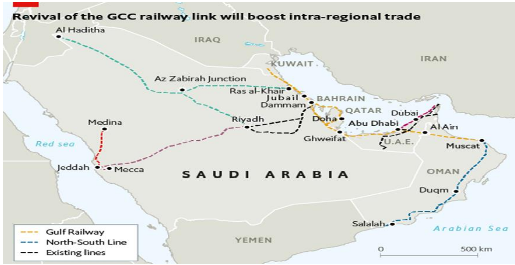
Dəmir yolu xəttinin regiondaxili keçid planı

Körfəzdə dəmir yolu infrastrukturu üçün potensial əhəmiyyətli inkişafı təmsil edən bu layihənin plana uyğun olaraq öncə şimalda paytaxt Küveytdən başlayaraq Səudiyyə Ərəbistanının sahilyanı Cübeyl və Dəmmam şəhərlərindən, daha sonra Bəhreynin paytaxtı Manama və Qətərin paytaxtı Dohadan keçəcəyi nəzərdə tutulur. Dəmir yolu xətti daha sonra Səudiyyə Ərəbistanına dönərək Birləşmiş Ərəb Əmirliklərinə (BƏƏ) keçəcək və burada Əbu-Dabi, Dubay və Fuceyrə kimi böyük şəhərlərdən keçərək Omanın paytaxtı Maskatda son dayanacağına çatacaq. 12