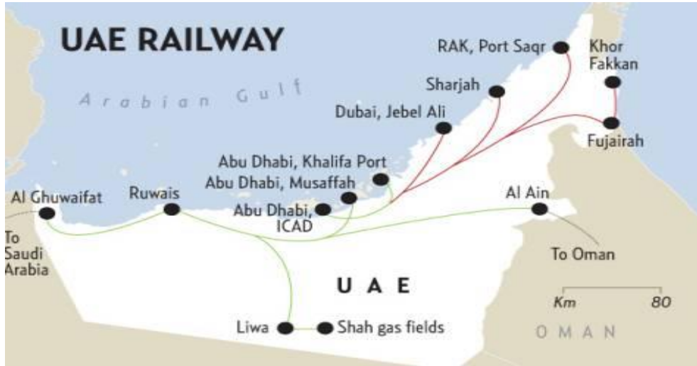
“Körfəz qatarı” layihəsinin əsas elementi olan BƏƏ - “Ettihad” dəmir yolu xətti

Şəbəkənin əsas elementi Oman körfəzindən Ərəb körfəzinə qədər Birləşmiş Ərəb Əmirlikləri (BƏƏ) boyunca uzanan 1200 kilometrlik, 11 milyard dollar dəyərində yük və sərnişin dəmir yolu olan “Ettihad” dəmir yoludur. Hazırda tikinti işlərinin icra olunduğu BƏƏ-nin ilk milli beynəlxalq dəmir yolu şəbəkəsi iki mərhələdə tikilir. Birinci mərhələ 2016-cı ildə tamamlanıb və Əbu-Dabidəki Həbşan və Şah rayonlarından Ruveys limanına qədər 264 kilometr məsafəni əhatə edir. Layihənin ikinci mərhələsi BƏƏ-nin 11 şəhərini əhatə etməkdədir. Tikinti işlərinin səhrada aparılması, tikinti sahələrində havanın temperaturunun yüksək olması, qum küləklərinin tikinti işlərinə maneəsi tikinti işlərinin ləng getməsinə səbəb olurdu. Bu baxımdan “Ettihad” şirkəti bu işdə daha təcrübəli olan Çin, Mavritaniya və Səudiyyə Ərəbistanının təcrübəsindən faydalandı. Belə ki, şirkət bu ölkələrin qum təpələrini gilə çevirmək, qum axınının hərəkətini izləyərək küləyin qarşısını almaqda bitki divarlarının hörülməsi təcrübəsindən faydalanaraq işlərin icrasını sürətləndirmişdir.